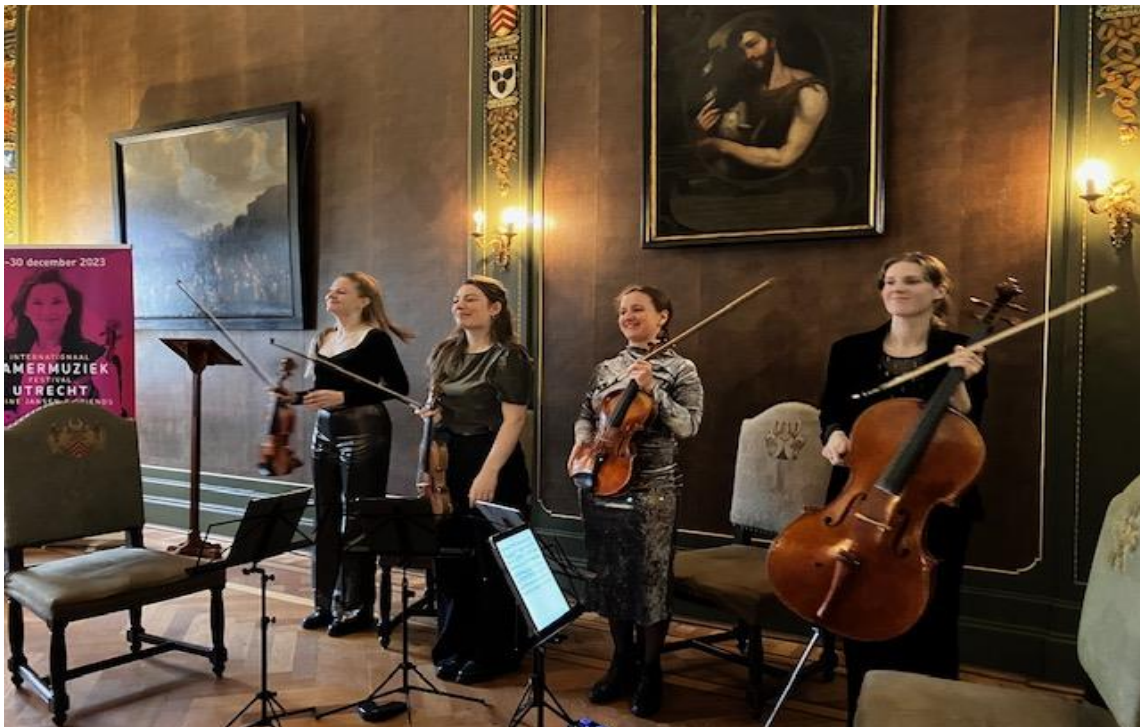
ADAM Quartet tijdens het Internationaal Kamermuziekfestival Utrecht, Maltezer Huis, 29 dec. 2023